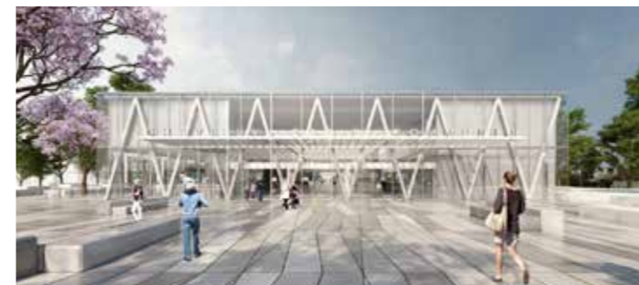
Future gare Métro Chevilly Trois Communes