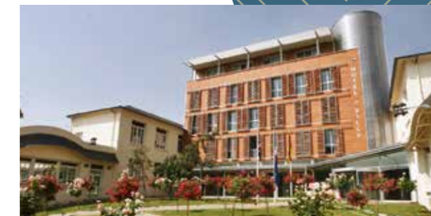
Hotel de Ville