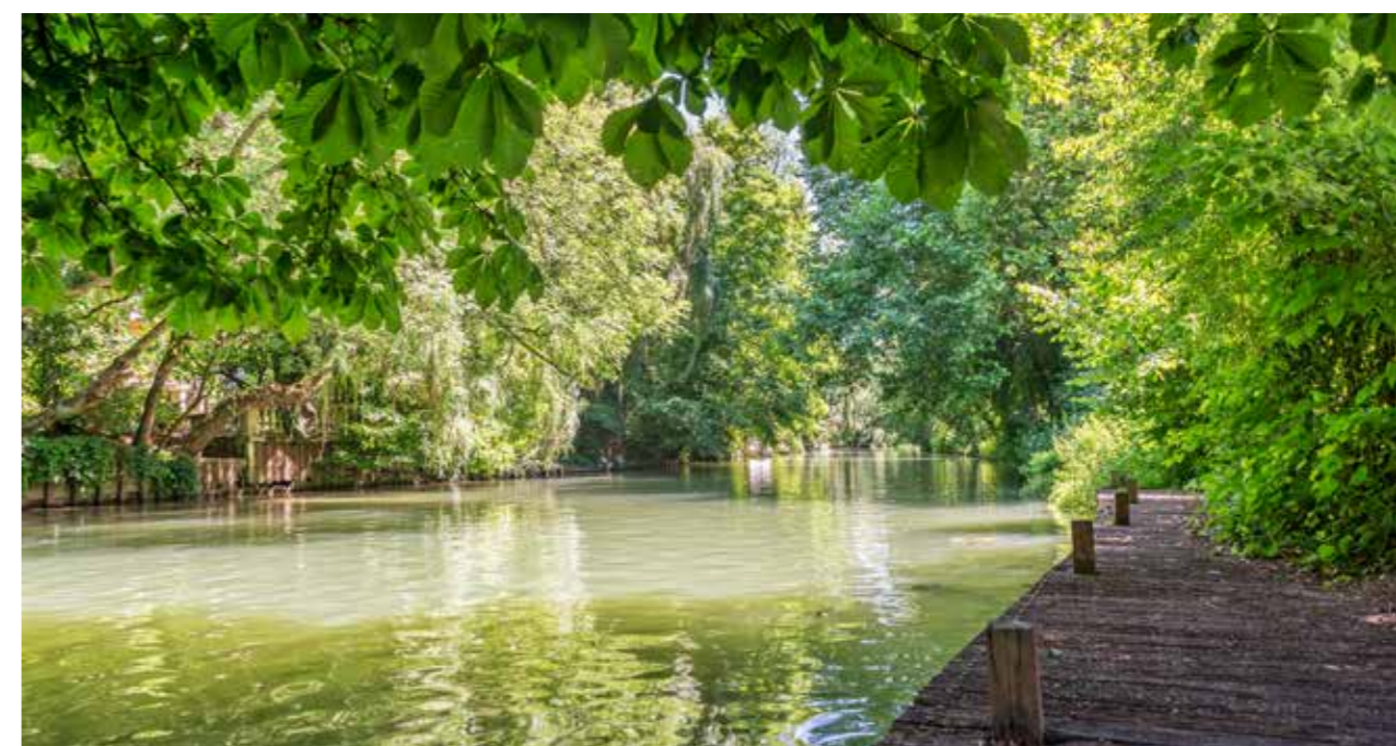
La petite Venise du Val de Marne