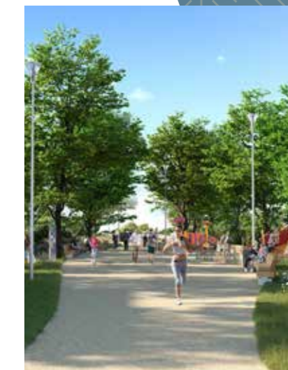
Chemin de la Vanne - Coulée verte