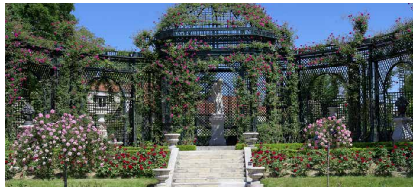
La Roseaie du Val de Marne