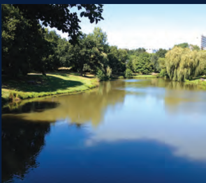
Parc du Val de Chézine

Saint-Herblain offre également un cadre de vie agréable alliant ville et nature grâce aux 430 hectares d'espaces verts dont 5 parcs aménagés présents sur son territoire. Sa situation à l'ouest de la métropole permet par ailleurs un accès rapide et facile aux plages de la côte atlantique (45 minutes de la Baule).