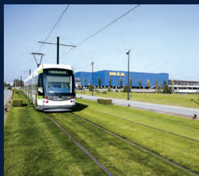
Tramway ligne 1 - Atlantis