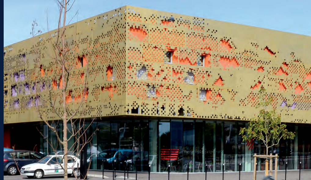
Maison des Arts