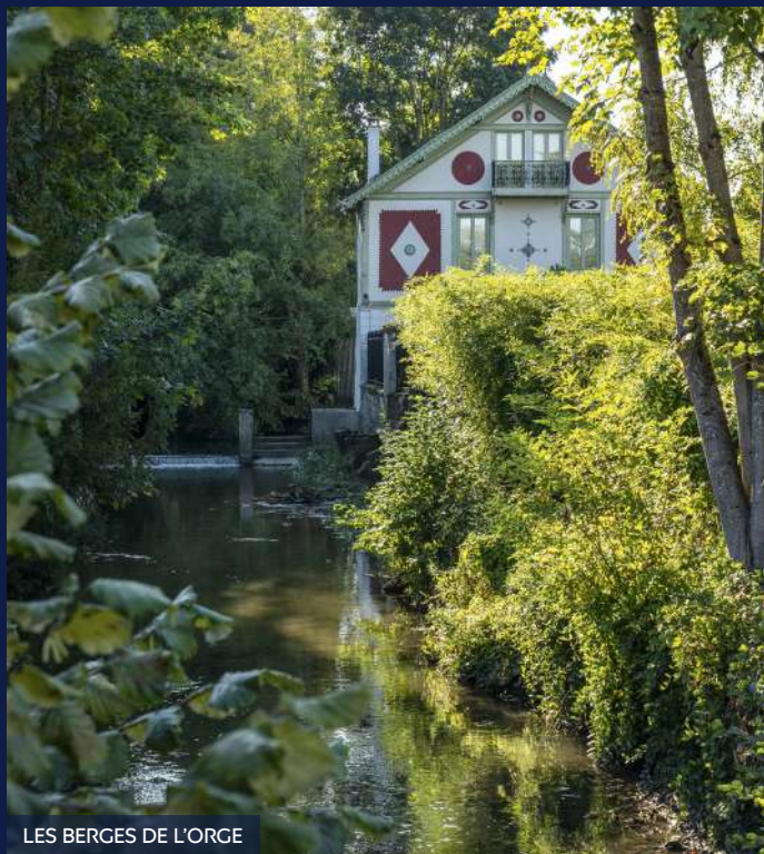
LES BERGES DE L'ORGE

Au quotidien, les Germinois profitent de commerces, de plusieurs grandes surfaces, d'un marché de produits frais, d'une clinique, d'écoles, de la maternelle au collège, de stades, de gymnases, d'un conservatoire de danse et de musique, d'une médiathèque et de toutes les infrastructures scolaires, culturelles et sportives des communes avoisinantes.